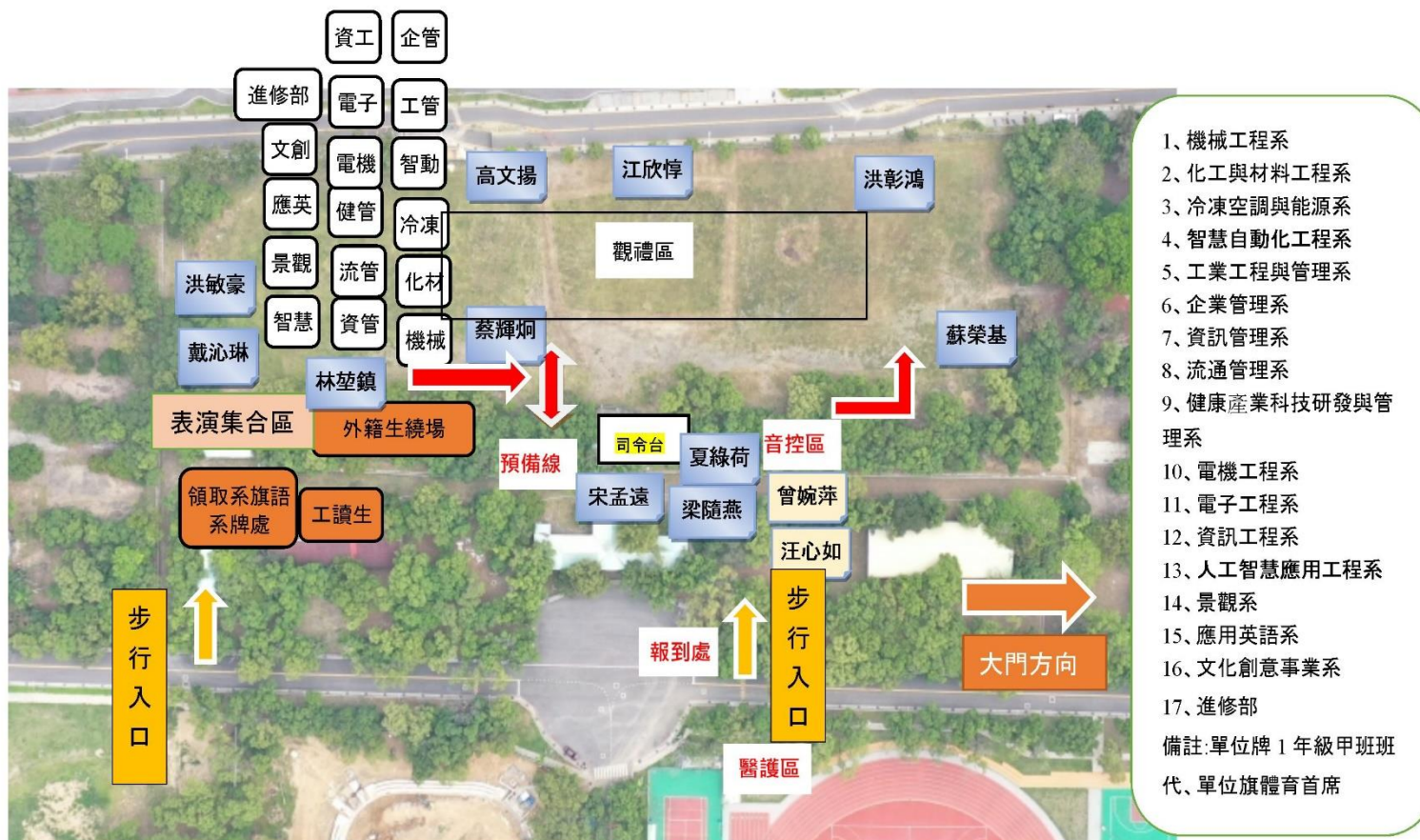
國立勤益科技大學 112 年校慶站位暨繞場位置圖