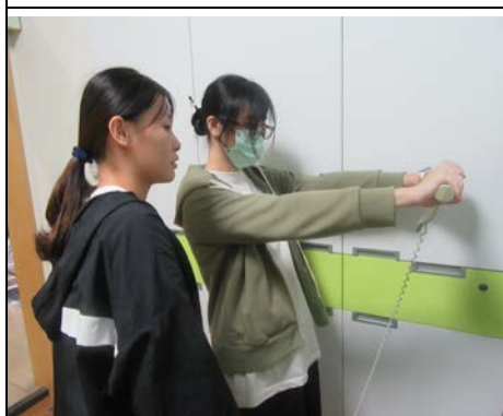
113 年 10 月 23 日體脂肪檢測服務