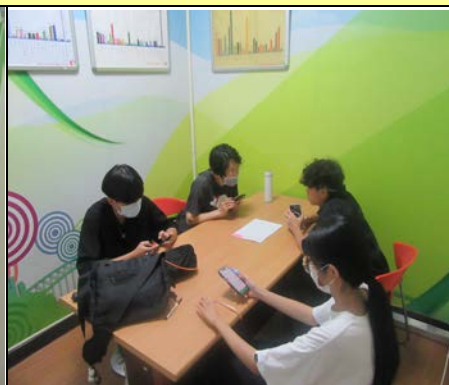
113 年 9 月 25 日營養諮詢服務