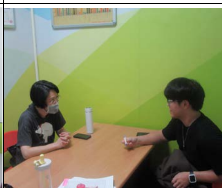
113 年 10 月 23 日營養諮詢服務