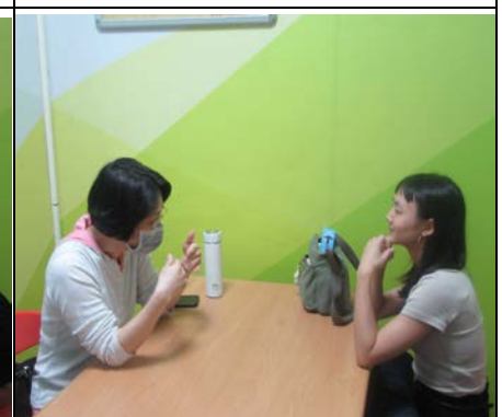
113 年 11 月 20 日營養諮詢