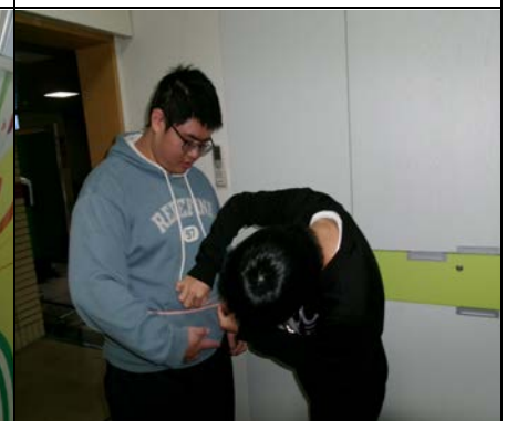
113 年 12 月 18 日腰圍測量服務