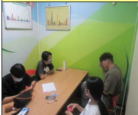
113 年 9 月 25 日營養諮詢服務