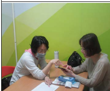
113 年 11 月 20 日營養諮詢