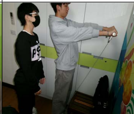
113 年 12 月 18 日體脂肪檢測服務