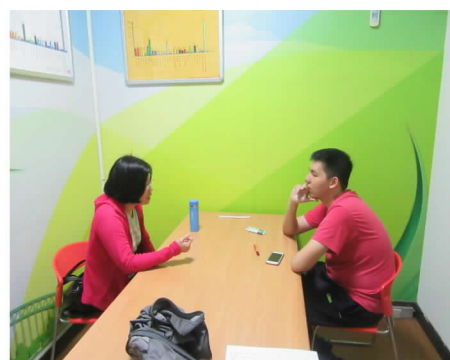
108 年 12 月 18 日個人營養諮詢