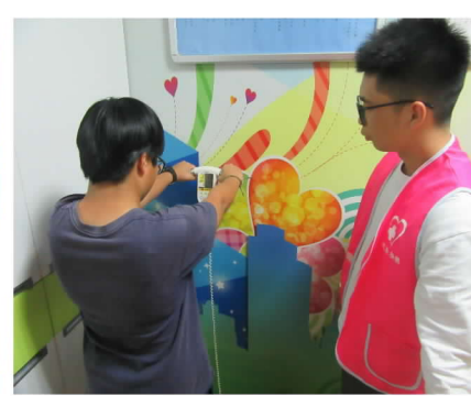
108/年 12 月 26 日體脂肪檢測服務