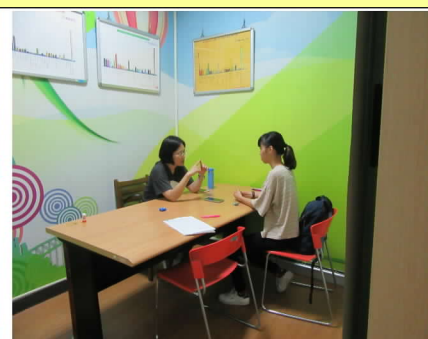
108 年 10 月 23 日營養諮詢活動情形