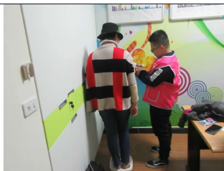
108 年 11 月 20 日體脂肪檢測服務