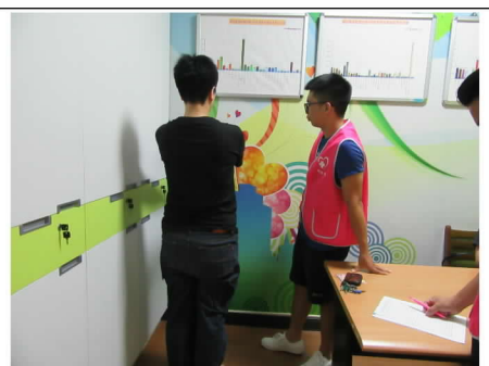
108 年 10 月 23 日營養諮詢活動情形