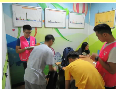
108 年 9 月 25 日團體營養諮詢