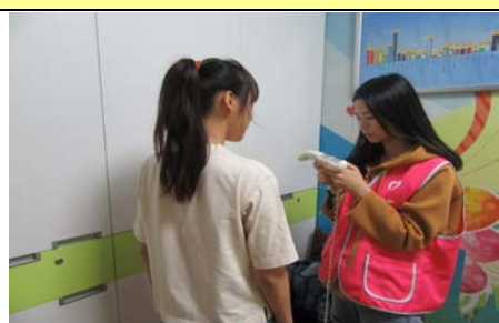
109 年 9 月 30 日體脂肪檢測服務