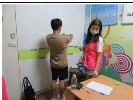
109 年 10 月 28 日營養諮詢活動情形