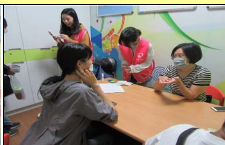
109 年 9 月 30 日團體營養諮詢