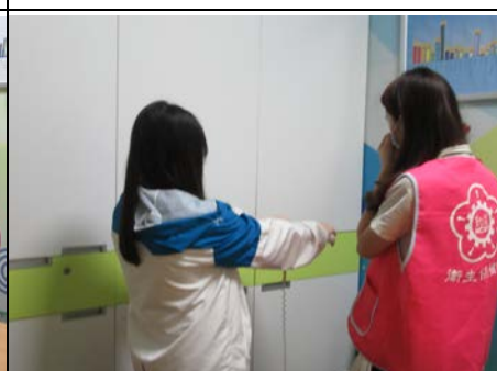
109 年 11 月 25 日體脂肪檢測服務