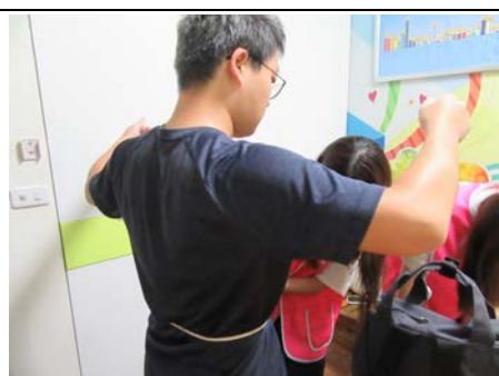
109 年 11 月 25 日腰圍量測服務