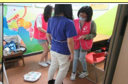
109 年 10 月 28 日腰圍量測服務