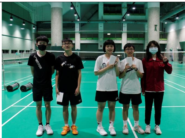
羽球男女各組第一名